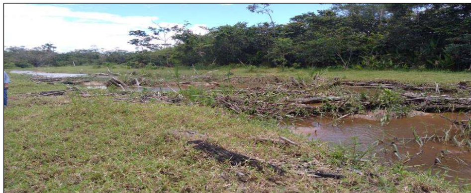
VISTA DEL PUNTO CRÍTICO EN EL RÍO AVISADO