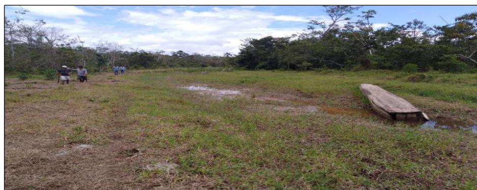
VISTA DEL PUNTO CRÍTICO EN EL RÍO AVISADO